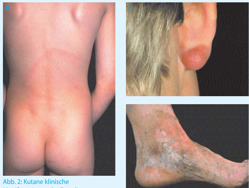
Abb. 2: Kutane klinische Manifestationen der Borreliose

Das Borrelien-Lymphozytom ist eine seltene Hautmanifestation, die nach Wochen bis Monaten auftritt und über Jahre persistieren kann. Es handelt sich um einen rötlich-lividen